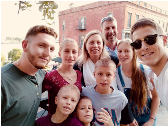
Familia Da Ponte, Venecia (Italia) - Bridgeport (Estados Unidos)