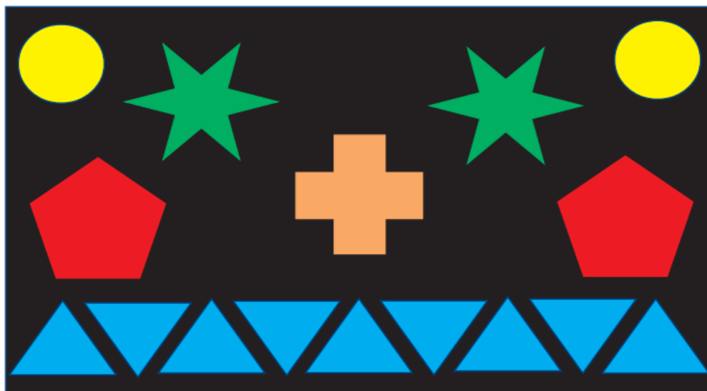
Modelo de cartulina extendida con cenefas de color